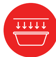
RESPECT by KGL